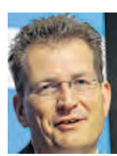
Ralf Brauksiepe.

Besucher können an diesem Tag den Ort des Wirkens der Bundestagsabgeordneten in Berlin anschauen und sich dort über die Arbeitsweise des Parlaments, den Arbeitsalltag der Abgeordneten und der Bundestagsverwaltung informieren.