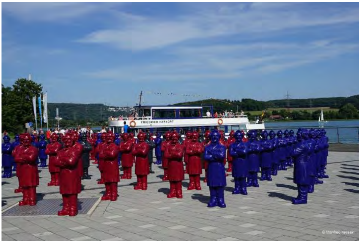
125 Friedrich-Harkort-Skulpturen a von Prof. Ottmar Hörl auf dem Platz am Harkortsee, Wetter (Ruhr) (August 2015)

Tausende Fotos wurden von den Ausstellungen und den Skulpturen geschossen. Der Fotograf Manfred Kressin aus Wetter (Ruhr) begnügte sich jedoch nicht mit dem Ablichten der Skulpturen, er gestaltete die Fotos auch. Ein Saxophon-Spieler brachte den aufmerksamen Friedrich-Harkort-Skulpturen auf dem Platz am Harkortsee sogar ein Ständchen.