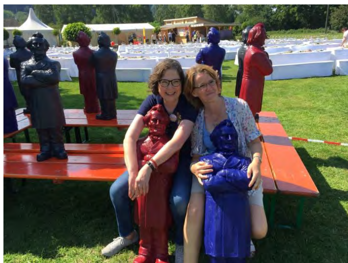
Friedrich-Harkort-Skulpturen von Prof. Ottmar Hörl mit Besucherinnen am Schleusenwärterhaus, Witten (August 2015)