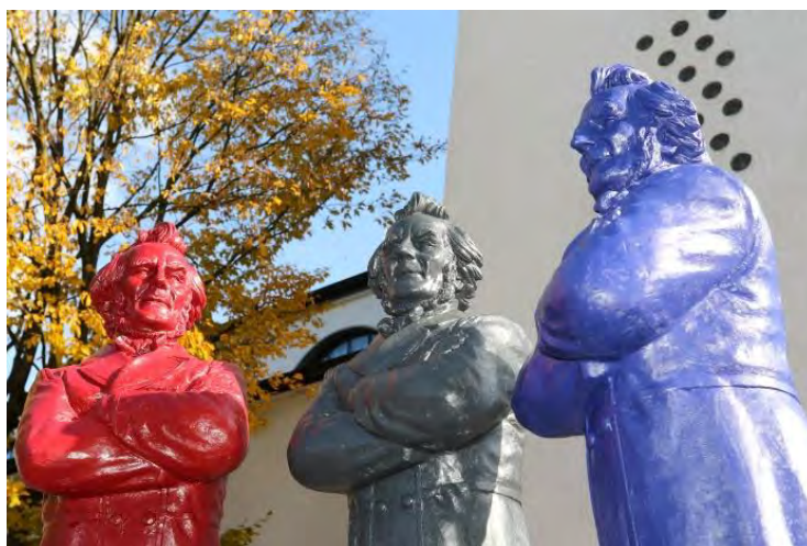
Friedrich-Harkort-Skulpturen von Prof. Ottmar Hörl auf dem Markt, Dortmund-Hombruch (Oktober 2015)