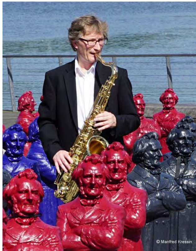
Friedrich-Harkort-Skulpturen von Prof. Ottmar Hörl mit Saxophon-Spieler auf dem Platz am Harkortsee, Wetter (Ruhr) (August 2015)