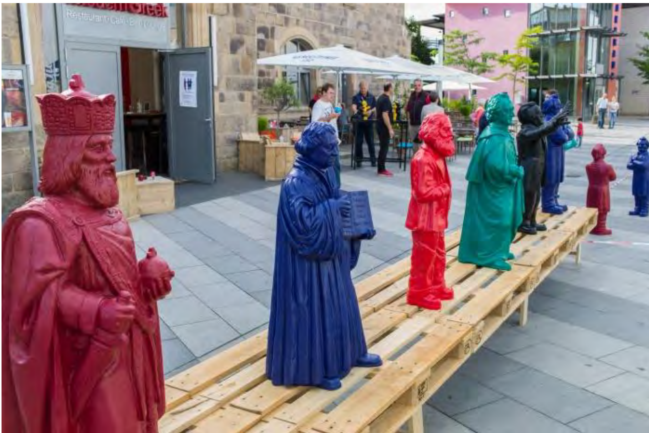
Skulpturen historischer Persönlichkeiten von Prof. Ottmar Hörl, Wetter (Ruhr) (August 2015), Karl der Große | Martin Luther | Karl Marx | Johann Wolfgang von Goethe | Richard Wagner | Friedrich Harkort

Nun galt es den Künstler anzusprechen. „Friedrich Harkort?“ Der Industriepionier, Bildungs- und Sozialreformer war Prof. Ottmar Hörl bis dato noch kein Begriff. Zu dem Zeitpunkt hatte er bereits eine ganze Reihe von Installationen zu bedeutenden historischen Persönlichkeiten außer Karl dem Großen realisiert, wie Johann Wolfgang von Goethe, Martin Luther, Karl Marx, Arthur Rimbaud und Richard Wagner. Er wollte es sich überlegen. Beim zweiten Gespräch im Atelier in Wertheim hatte er sich intensiv mit Friedrich Harkort befasst. Besonders für dessen soziales Engagement empfand er große Sympathie und nicht zuletzt auch dafür, dass die Wetteraner Lions tatsächlich „wild entschlossen“ waren, alles zu tun, um das Projekt umzusetzen. Ging es dabei ja nicht nur um die Erwirtschaftung von Spendenmitteln, Friedrich Harkort sollte in Form eines zeitgemäßen Kunstwerks gewürdigt werden, um an dessen Wirken zu erinnern und um Zukunftsorientierung und Selbstbewusstsein der Stadt Wetter (Ruhr) sowie den Zusammenhalt der Harkort-Region zu fördern. Prof. Ottmar Hörl nahm den Auftrag für die künstlerische Gestaltung der Skulptur an.