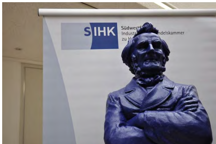
Friedrich-Harkort-Skulptur von Prof. Ottmar Hörl in der SIHK Südwestfälische Industrie- und Handelskammer zu Hagen (August 2015)

Hier entsteht eine regelrechte „Harkort-Location“. Seit einiger Zeit werden bereits das Geburtshaus von Friedrich Harkort und das Ökonomiegebäude aufwändig renoviert. Es gibt weitere Pläne im Hinblick auf die Renovierung des im bergischen Barockstil ausgeführten Herrenhauses und des steinernen Jungfernhauses sowie die Gesamtgestaltung und Nutzung des Ensembles „Gut Harkorten“. Möglicherweise bietet dieses Projekt weitere Chancen für das MeinFriedrich-Benefizkunstevent.