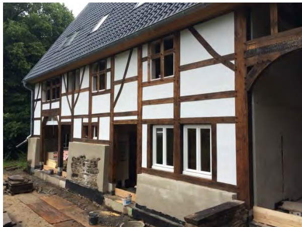
Geburtshaus Friedrich Harkorts und Ökonomiegebäude auf Gut Harkorten, Hagen-Haspe (Westerbauer)