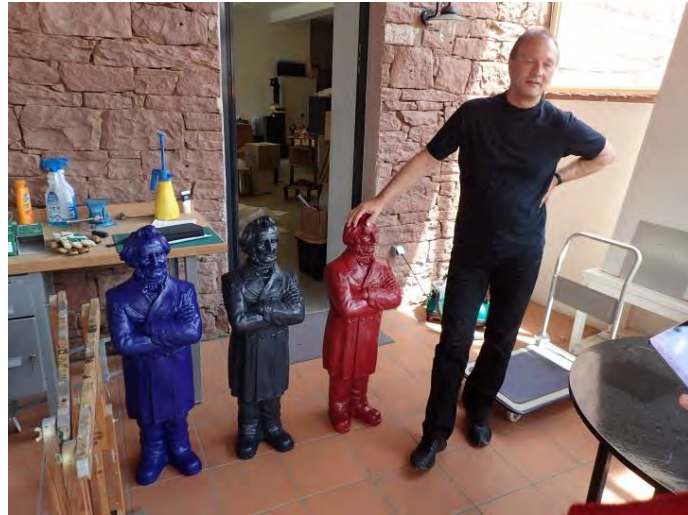
Original-Friedrich-Harkort-Skulpturen im Atelier von Ottmar Hörl in Wertheim (Juni 2015)

Im Juli 2015 waren alle 125 Skulpturen termingerecht vor Ort und wurden der Öffentlichkeit im Rahmen von insgesamt zehn aufeinander folgenden Ausstellungen in der Harkort-Region (Hagen, Herdecke, Hombruch, Wetter (Ruhr), Witten) vorgestellt. Die Definition der Harkort-Region ergab sich aus dem Leben und Wirken von Friedrich Harkort. Für die Präsentation in den verschiedenen Städten konnte der Lions Förderverein Wetter (Ruhr) e. V. die Lions Clubs Dortmund-Hanse, Hagen-Harkort und Herdecke als Kooperationspartner gewinnen. In Dortmund-Hombruch unterstützten außerdem das Hombruch-Forum und das Stadtbezirksmarketing die Aktivitäten. In Witten engagierte sich Prof. Dr. habil. Detlef H. Mache vom Lions Club Witten mit seiner Initiative Bildung und Kultur e. V..