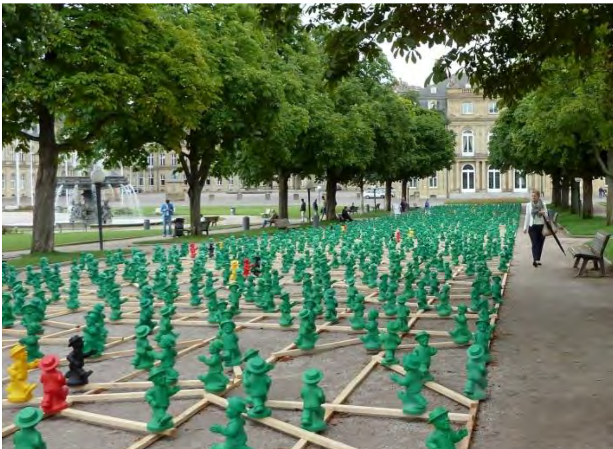
Einheitsmännchen-Skulpturen von Prof. Ottmar Hörl, Stuttgart (2015)