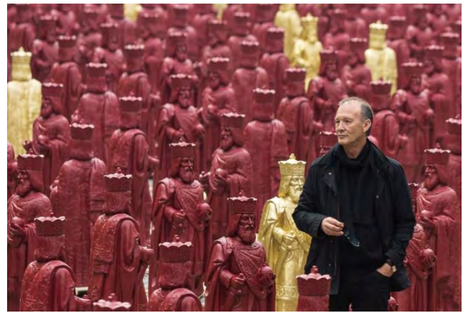
Ottmar Hörl: Karl-der-Große-Skulpturen, Aachen (2014)

Friedrich Harkort's persönliches Umfeld lag in der westfälischen Stadt Hagen und deren Umgebung im Ruhrgebiet. Geboren wurde er auf Gut Harkorten in Hagen-Haspe / Westerbauer. Er wohnte und wirkte lange in Wetter an der Ruhr und seit den 1840er Jahren bis zu seinem Tod im heutigen Dortmund der Stadtteil Hombruch. Familiäre Beziehungen verbanden ihn auch mit Witten. Beerdigt wurde er in der Erbbegräbnisstätte Harkort bei Gut Schede in Herdecke. Diese durch den Lebenslauf von Friedrich Harkort verbundenen fünf Orte kann man getrost als „Harkort-Region“ bezeichnen.