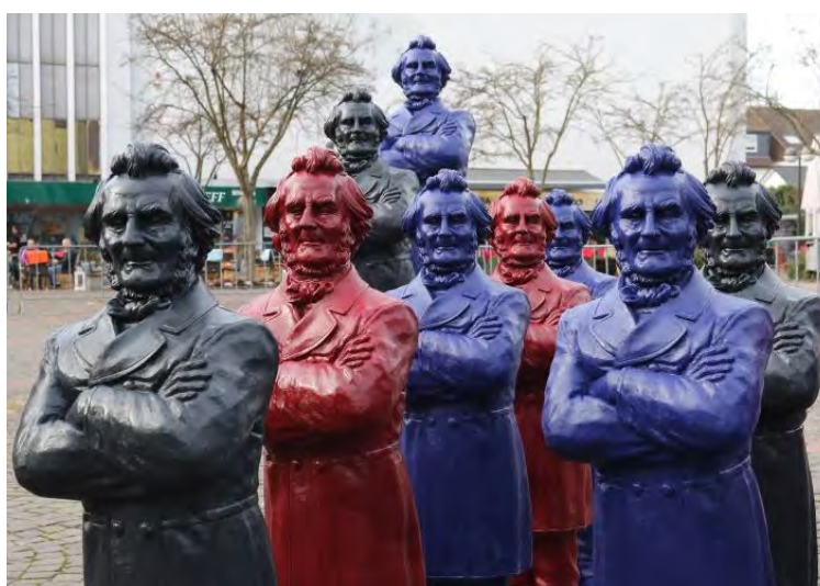
Friedrich-Harkort-Skulpturen von Prof. Ottmar Hörl auf dem Markt, Dortmund-Hombruch (November 2015)