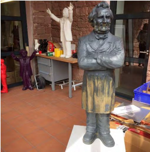
Wachsmodell Friedrich Harkorts im Atelier von Ottmar Hörl in Wertheim (April 2015)