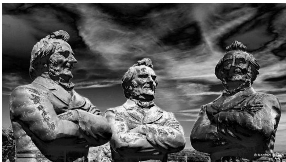
Bearbeitetes Foto mit Friedrich-Harkort-Skulpturen, Wetter (Ruhr) (August 2015)

Tausende Fotos wurden von den Ausstellungen und den Skulpturen geschossen. Der Fotograf Manfred Kressin aus Wetter (Ruhr) begnügte sich jedoch nicht mit dem Ablichten der Skulpturen, er gestaltete die Fotos auch. Ein Saxophon-Spieler brachte den aufmerksamen Friedrich-Harkort-Skulpturen auf dem Platz am Harkortsee sogar ein Ständchen.