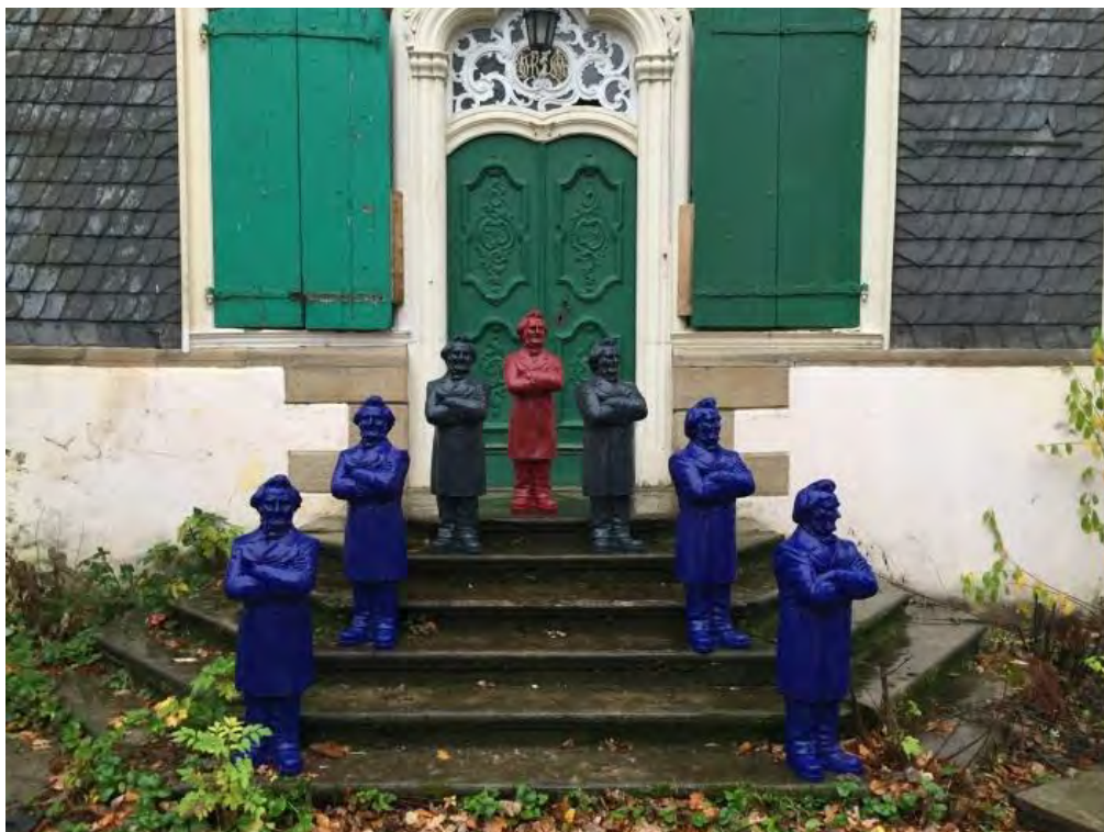
Ottmar Hörls Friedrich-Harkort-Skulpturen vor dem Herrenhaus auf Gut Harkorten, Hagen-Haspe (November 2015); © Lions Club Wetter (Ruhr) Foto: Dr. Helmut Franzen

Eine aktuelle Würdigung erfuhr Friedrich Harkort als bedeutender und prägender Westfale auch im Rahmen der Ausstellung „200 Jahre Westfalen. JETZT!“ im Dortmunder Museum für Kunst- und Kulturgeschichte vom 28. August 2015 bis zum 28. Februar 2016