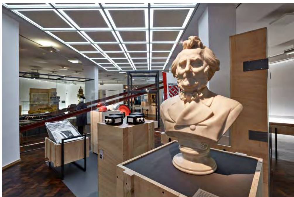
200 Jahre Westfalen. JETZT! – Museum für Kunst- und Kulturgeschichte (MKK), Dortmund TERRITORIUM mit Friedrich Harkort Büste

www.dortmund.de/de/freizeit_und_kultur/museen/mkk/200_jahre_westfalen_jetzt