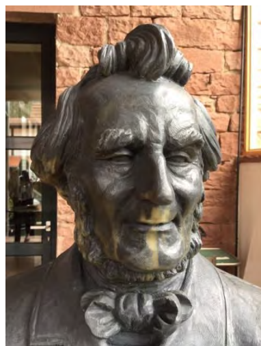
Wachsmodell Friedrich Harkorts im Atelier von Ottmar Hörl, Wertheim (April 2015)