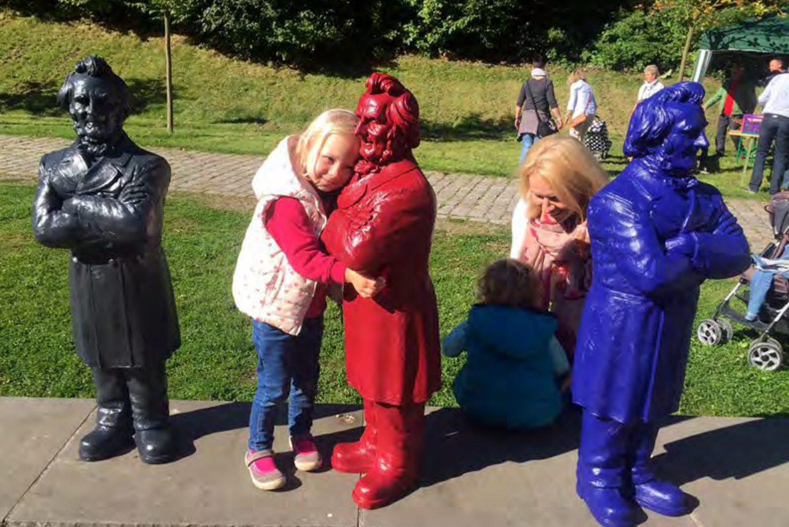
Ottmar Hörls Friedrich-Harkort-Skulpturen mit Besucherinnen im LWL-Freilichtmuseum, Hagen (2015).

der mehrtägigen Trocknungsphase mit verschiedenen Farben. Höhepunkt des Kunstprojektes waren die Ausstellung und der Verkauf der Skulpturen im November 2016 auf dem Martini-Markt. Das Projekt wurde vom Hombruch-Forum und vom Stadtbezirksmarketing Hombruch unterstützt.