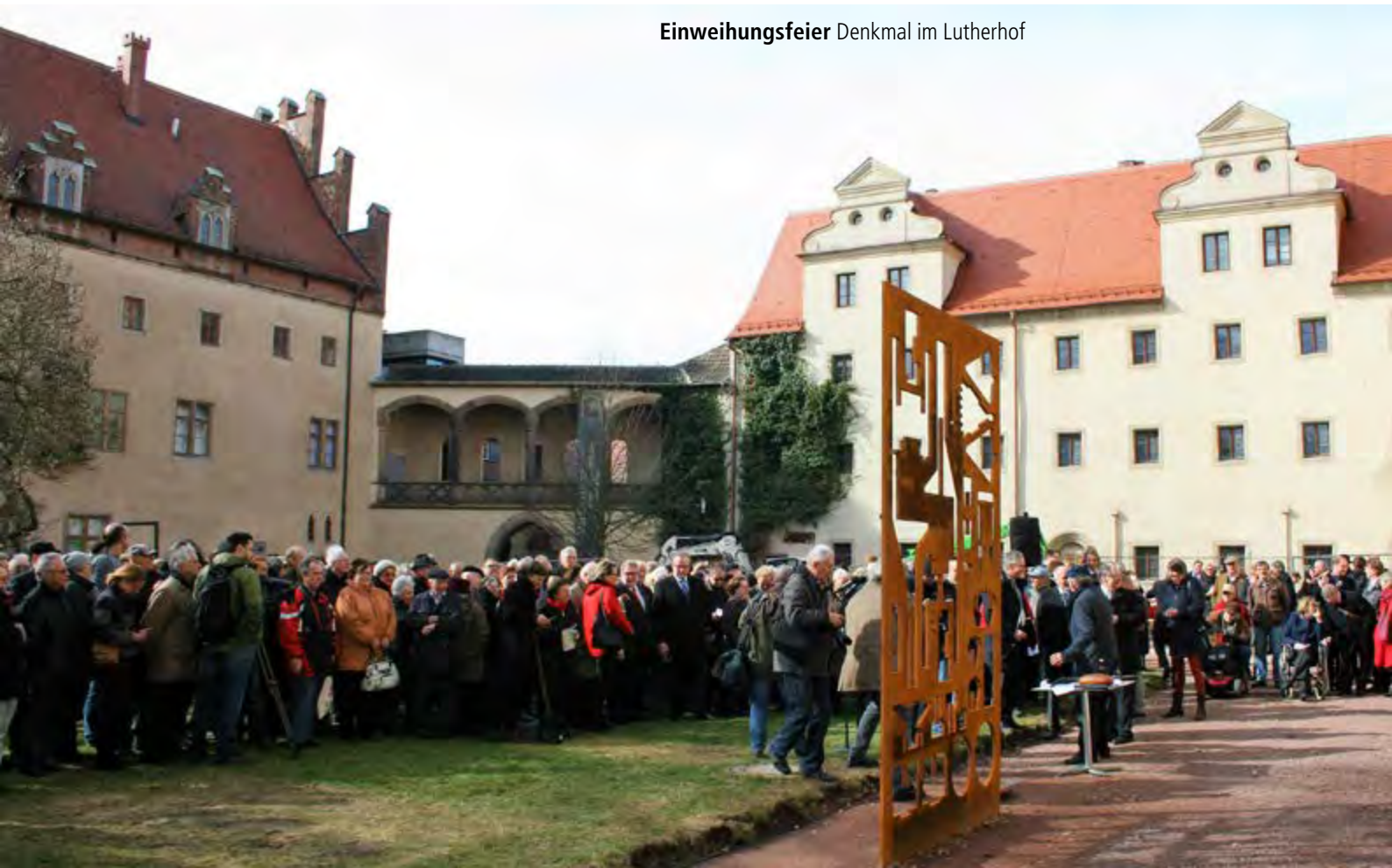
Einweihungsfeier Denkmal im Lutherhof

Das Denkmal ist eine zwei Meter breite und gut drei Meter hohe Cortenstahl-Installation. Bei genauer Betrachtung sind in der drei Zentimeter dicken Stahlplatte die Umrisse von Werkzeugen und Ausrüstungsgegenständen einer Schmiede zu erkennen. Auch ein Schwert und ein Hammer im Maßstab 1:1 sind zu sehen. ▶